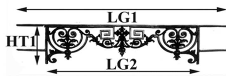
Schéma explicatif dimensionnel